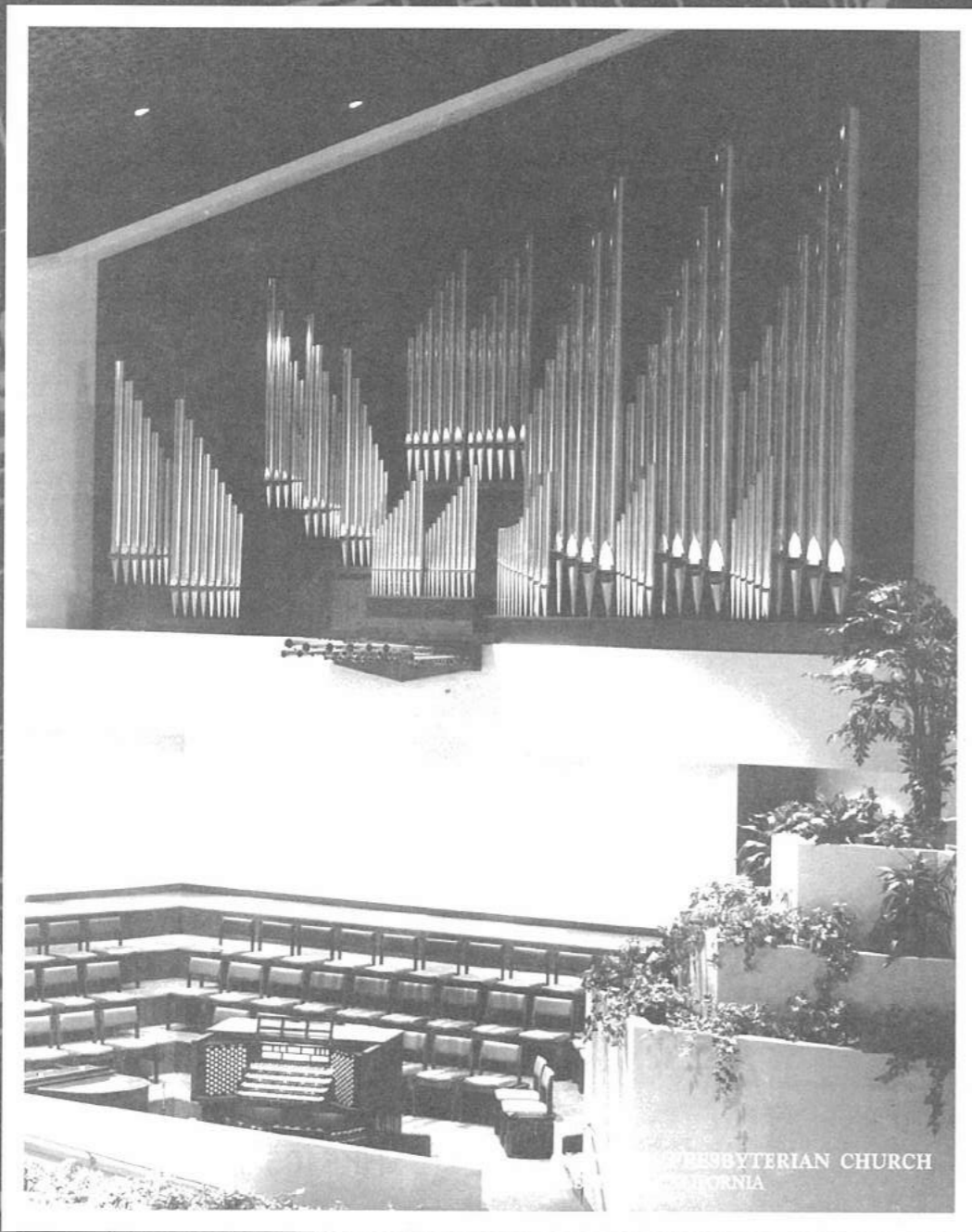
PRESBYTERIAN CHURCH HONG KONG