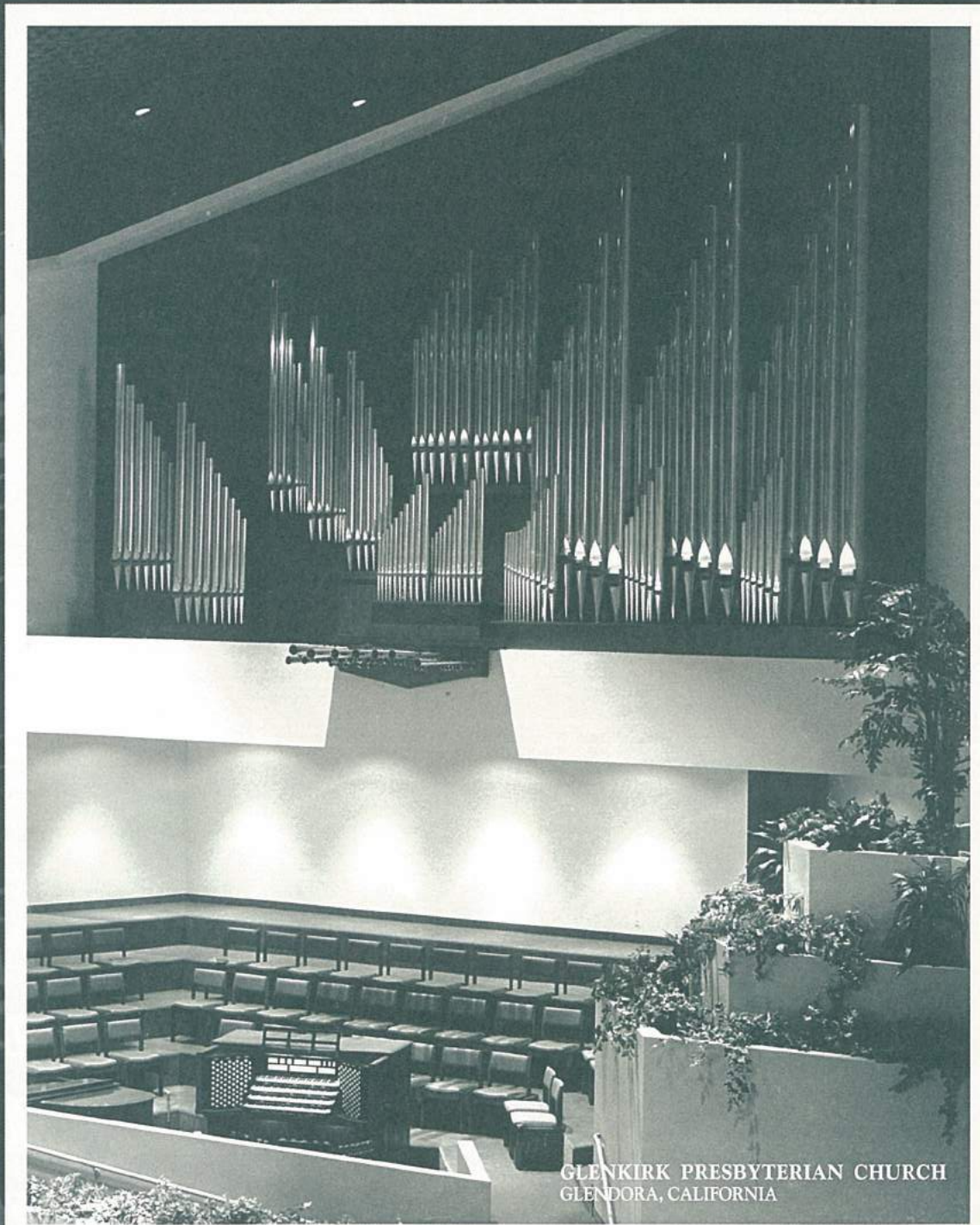
GLENKIRK PRESBYTERIAN CHURCH GLEN DORA, CALIFORNIA