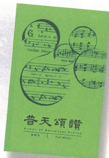
音樂本(中英對照) 旋律本(中文)