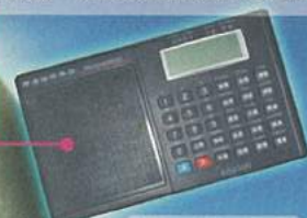
《世紀頌讚》伴奏器 編號：MUS240 售價：HK$1,380

「《世紀頌讚》伴奏器」內含《世紀頌讚》的全部詩歌，使用者可選擇演繹全曲、前奏部份、兩首詩歌的間奏部份又或高音旋律部份來帶領會眾。伴奏器曲調可升降，速度可增可減，是詩班員的必然選擇。