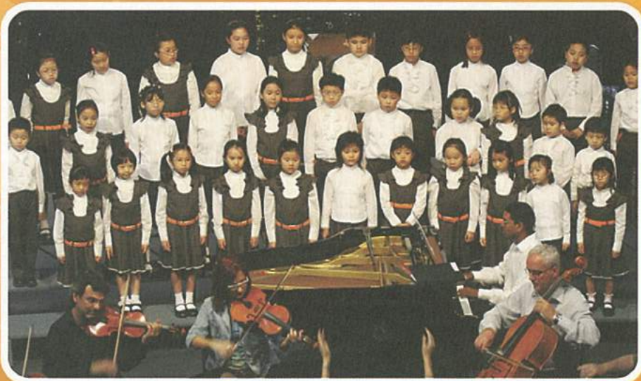
兒童合唱團於意大利領事館所主辦的慶祝歐盟50週年音樂會上與著名意大利NOVA 管弦樂團合力表演

香港音樂發展協會以「美聲唱法」教授兒童演繹著名西洋歌劇選段、經典的宗教作品以及各類中文、英文、意大利文、法文及德文名曲。