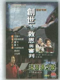
MADVD6021 創世、救恩與審判，流浪漢之歌DVD