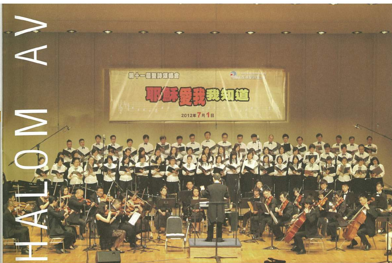
第十一屆聖詩頌唱會@沙田大會堂