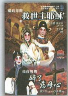
MADVD6020 救世主耶穌，碎了慈母心DVD